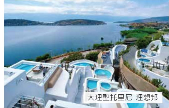
大理聖托里尼-理想邦

1 【深圳福田口岸】集合 ~ 包乘地下鐵前往【深圳北站】（或經廣州南站中轉） 前往雲南【昆明】 必蒲點 都市之眼【 七彩雲南第一城 《自行品嚐當地特色宵夜》】