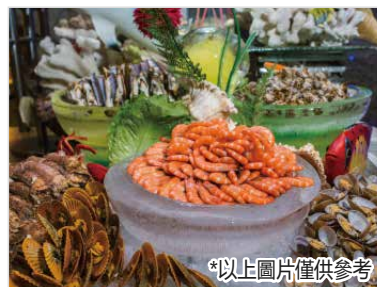
*以上圖片僅供參考