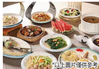
*以上圖片僅供參考

深圳集合時間及地點 09:00 [福田口岸] 集合 (11號門外) 出團時認準“廣東旅遊”旗幟 10:00 深圳灣口岸集合 (逾時不候)