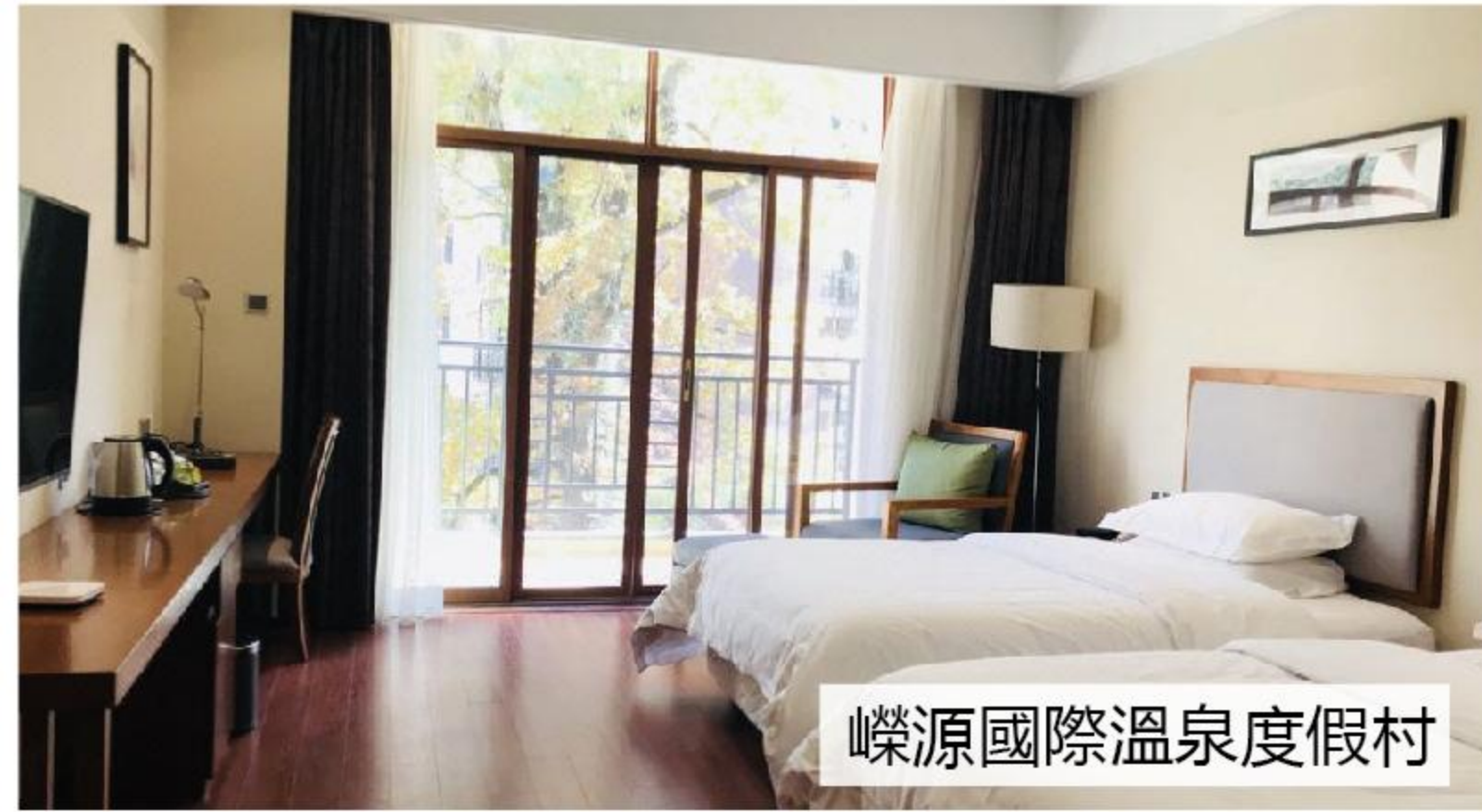
嶺源國際溫泉度假村