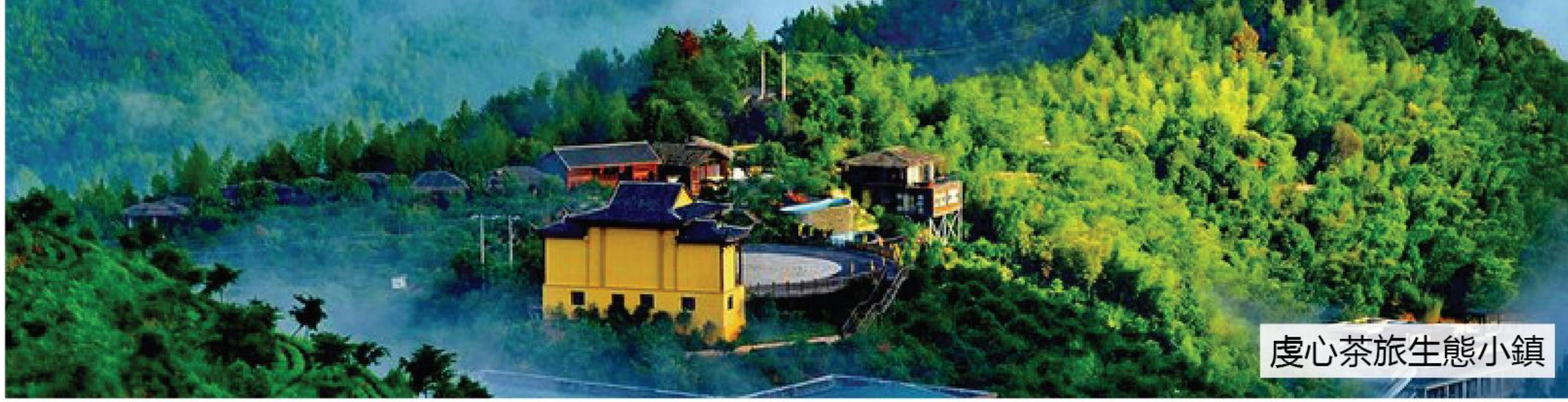
虔心茶旅生態小鎮