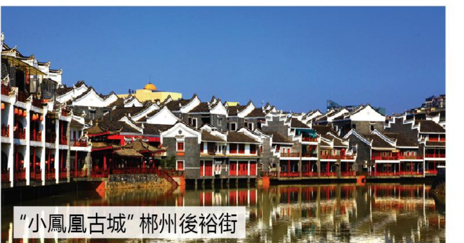
“小鳳凰古城” 郴州後裕街

備註: 1)行程、酒店、及膳食次序有可能因實際情況而變動, 以當地接待社安排為準, 如有任何更改, 恕不另行通知。 2)團隊必須跟團來回, 不設停留。客人如中途離團, 一切責任由客人自負。 3)建議旅客出發前購買旅遊綜合保險。 4)團費不包旅行團服務費HK$100/天/位(包括: 當地導遊、旅遊車司機及旅行社相關人員)團員可於完團前交付本公司職員(本司不安排香港領隊隨團出發)。 5)團費價錢只適用於香港旅遊證件持有人, 團費均以報名時為準, 旺季期間可能有所調整恕不另行通知。 6)顧客參與既有行程活動或自費活動時, 須遵守工作人員之指引及安排, 並自行衡量身體狀況, 如有疑問可自行向醫生或專業人士尋求意見。行程活動或自費活動於當地有不同之限制有機會未能參與。如因當地條件、天氣或緊急維修或其他不受控之情況下而未能進行活動或顧客因當地限制未能參與, 本公司不會作出任何賠償。 7)酒店在未獲有關單位按國家規定的標準正式評級期間, 本社以「X星標準」標示酒店級數, 以便客人參考。 8)12歲以下為小童收費(不佔床)團中部份景點以高度為入場收費準則, 如客人超過小童高度, 便需於入場前自行補回差額如團中已滿12歲者, 亦需按成人收費。 9)因每個季節所呈現的景色不同, 實景以現場呈現為準;菜單內容, 可能因時節及供應環境有所調整, 以當地接待餐廳安排為準, 本行程提供之圖片僅供參考。 10)服務供應商已提供團隊優惠, 不會再另外提供景區門票優惠的差額退款。 11)所有已包門票只包含首次入場門票, 不包含景區內其它額外收費項目。 12)為保障消費者權益, 請詳細參閱『旅遊細則及責任問題』附件上之條款; 自費活動之資料請參閱有關須知或細則。 13)團隊在旅途中因車輛機械故障所屬、塞車、輪渡取消等不可抗力因素導致行程影響或延誤, 我社將不作任何性質補償, 如產生費用將由旅客自付。