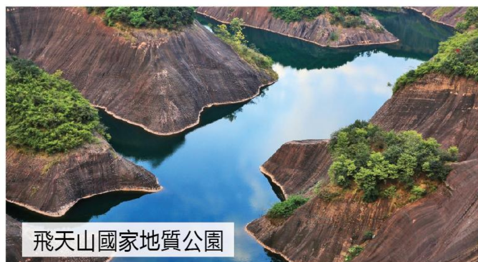
飛天山國家地質公園