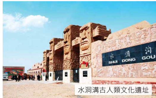
水洞溝古人類文化遺址