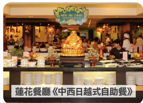
蓮花餐廳《中西日越式自助餐》