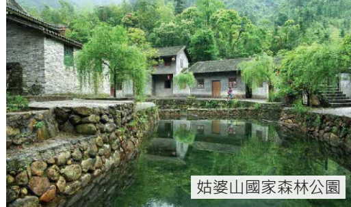
姑婆山國家森林公園

【深圳福田口岸】集合 ~ 包乘地下鐵前往【深圳北站】(或經廣州南站中轉) *前往山水城市【賀州】