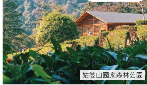
姑婆山國家森林公園