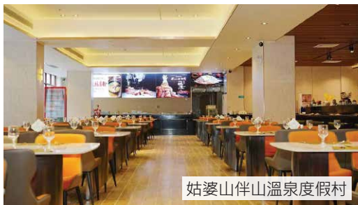
姑婆山伴山溫泉度假村