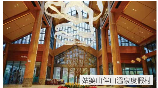
姑婆山伴山溫泉度假村