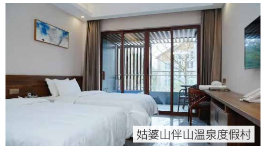
姑婆山伴山溫泉度假村

備註： 1)行程之航班及車次僅作參考，以實際出票時間為準。酒店、膳食、行程次序有可能因應實際情況而變動，以當地接待社安排為準，如有任何更改，恕不另行通知。 2)旅遊業監管局(TIA)建議旅客出發前購買旅遊綜合保險。 3)為保障消費者權益，請詳細參閱報名收據背面『旅行團報名及責任細則』附件上之條款；而簽證、延期停留及自費活動之資料請參閱有關須知或細則。 4)建議全程旅遊服務費合共為HK$100/天/位(包括：當地導遊、旅遊車司機及旅行社相關人員之全程服務費，本社將因應旅行團情況是否安排香港領隊隨團出發)。 5)團費價錢只適用於香港旅遊證件(包括特區護照、英國(海外)國民護照及回鄉證)持有人。 6)酒店在未獲國家規定的標準正式評級期間，本社以「X星標準」標示酒店級數，以便客人參考。 7)因每個季節所呈現的景色不同，實景以現場呈現為準，本行程提供之圖片僅供參考。 8)服務供應商已提供團隊優惠價格，長者或小童團員已享團費優惠，將不會再額外獲得優惠的差額退款。 9)有關高鐵團隊，如貴賓有綁定12306系統，將有機會收到短信通知出票信息，請勿擅自退票，如有疑問，請與本社職員聯繫。 10)在旅途中如遇到旅遊景區或步行街內有售賣特產或工藝紀念品等，與旅行社安排無關，請貴客們了解清楚是否需要購買，我社不作退換或任何投訴，敬請留意。