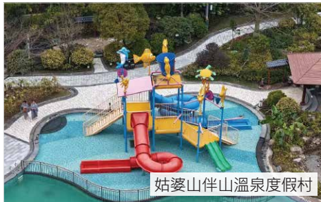
姑婆山伴山溫泉度假村