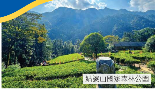
姑婆山國家森林公園