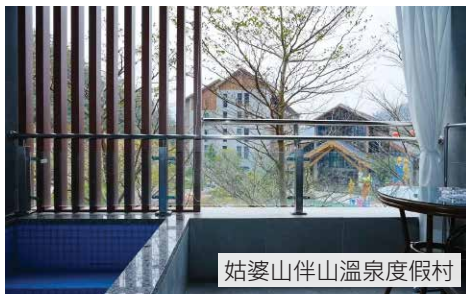
姑婆山伴山溫泉度假村