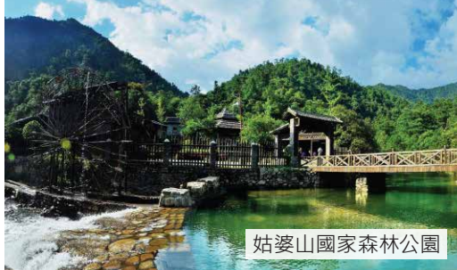
姑婆山國家森林公園