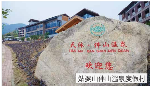
姑婆山伴山溫泉度假村

【賀州】(或經廣州南站中轉) * 抵達【深圳北站】~ 包乘地下鐵前往【深圳關口】解散