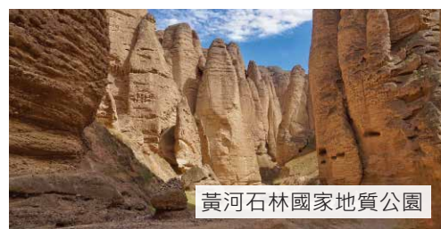
黃河石林國家地質公園