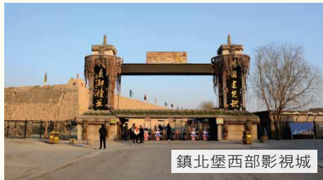
鎮北堡西部影視城