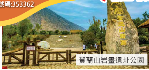
賀蘭山岩畫遺址公園