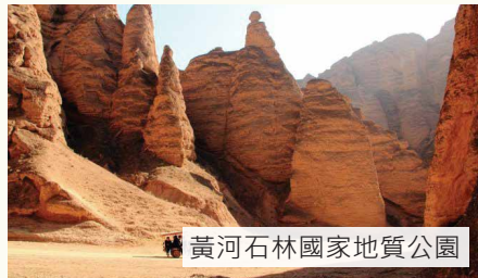
黃河石林國家地質公園