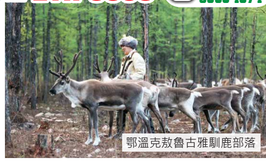
鄂溫克敖魯古雅馴鹿部落