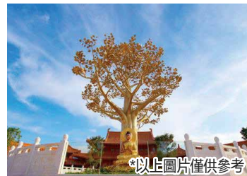
*以上圖片僅供參考

深圳集合時間及地點 08:30 深圳灣口岸集合 出團時認準“廣東旅遊”旗幟 09:30 [福田口岸]集合 (11號門外) (逾時不候)