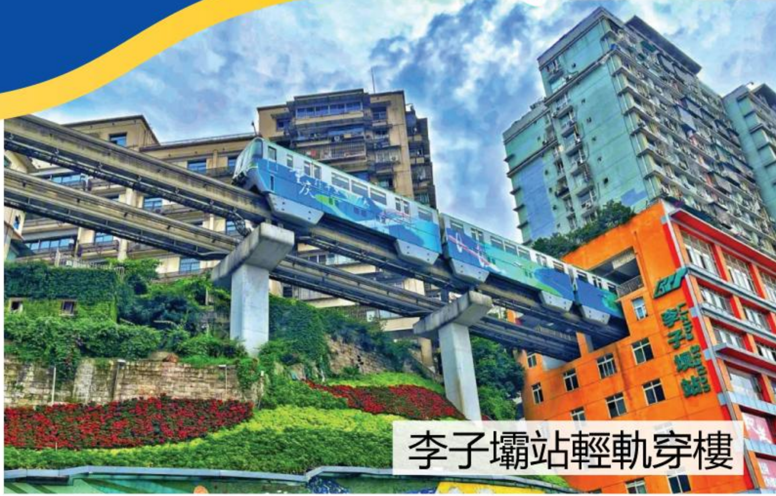
李子壩站輕軌穿樓