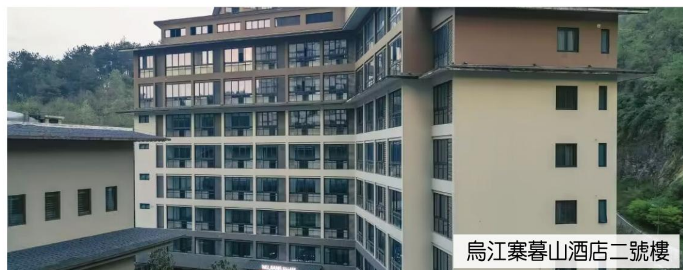
烏江寨暮山酒店二號樓