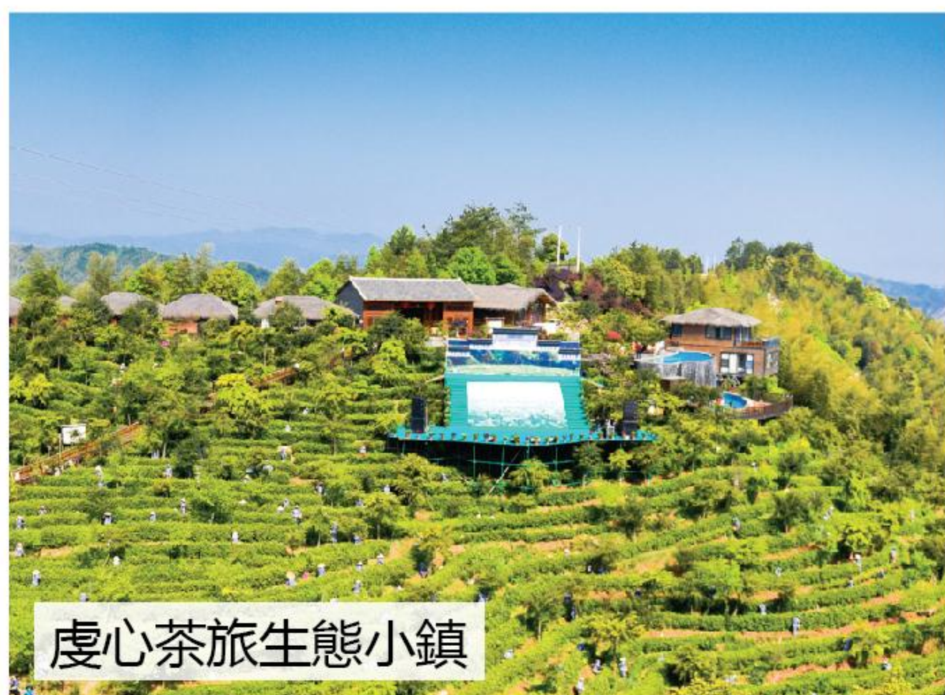
虔心茶旅生態小鎮