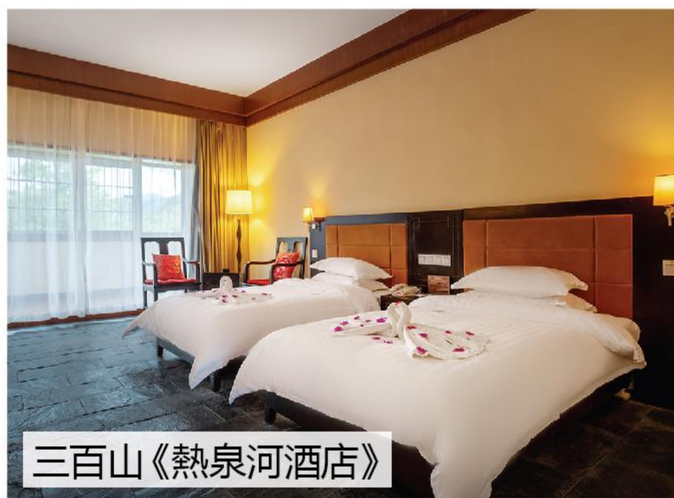
三百山《熱泉河酒店》