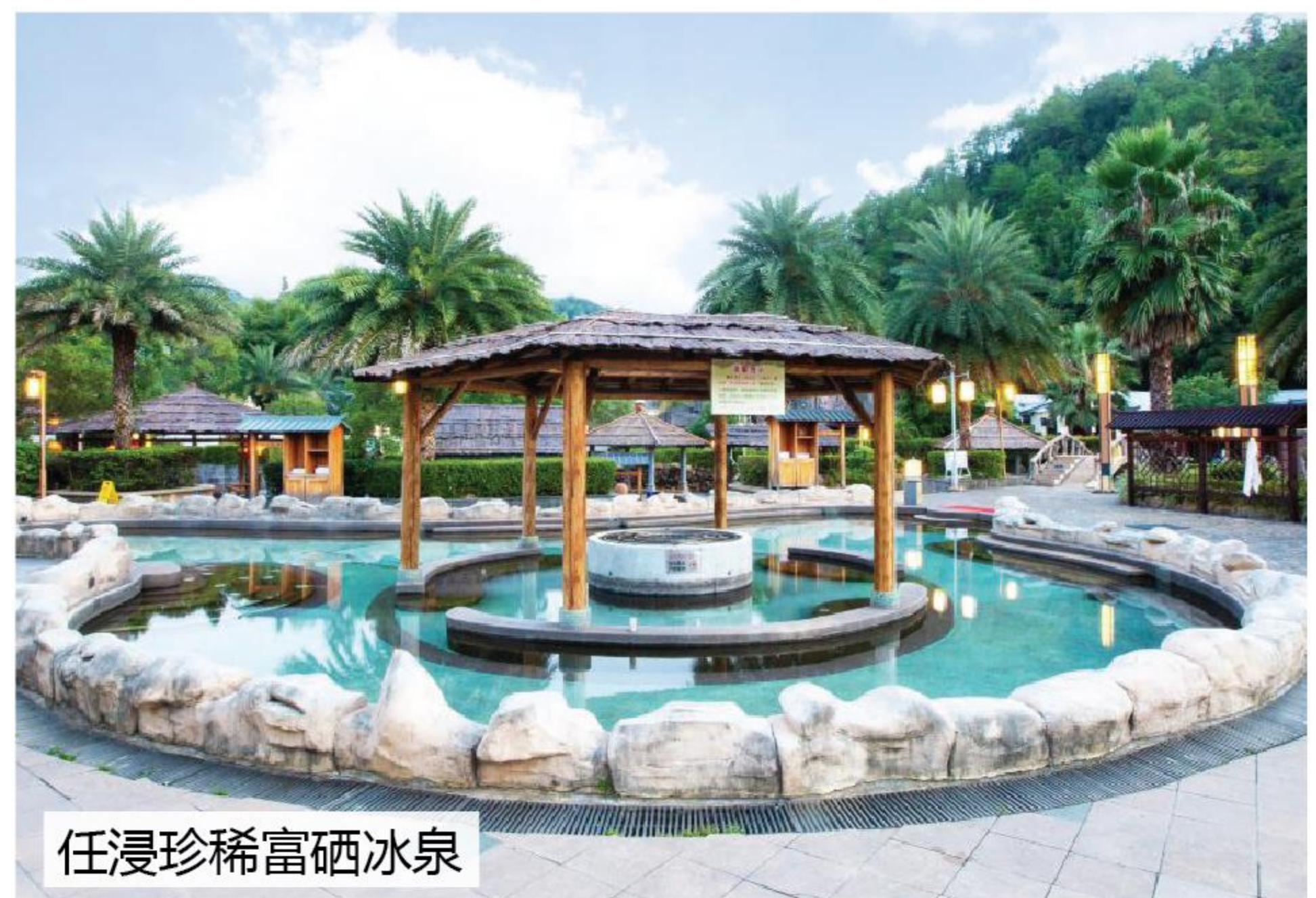
任浸珍稀富硒冰泉

備註:1)行程、酒店、及膳食次序有可能因應實際情況而變動,以當地接待社安排為準,如有任何更改,恕不另行通知。