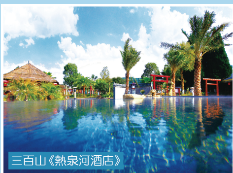
三百山《熱泉河酒店》

深圳灣口岸 07:45 福田口岸(11號門) 08:30 集合時間謹供參考 在大假期有可能作出更改 一切以本社通知為準 敬請準時集合 逾時不候