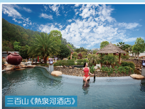
三百山《熱泉河酒店》