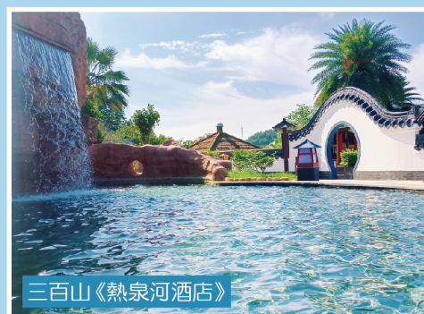
三百山《熱泉河酒店》