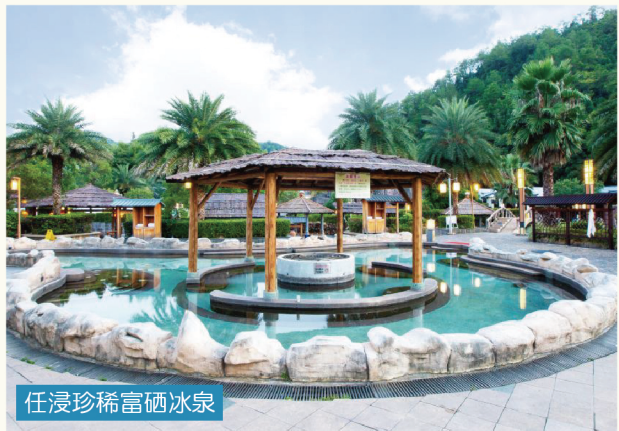
任浸珍稀富硒冰泉