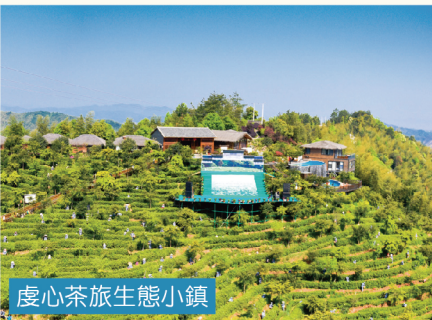
虔心茶旅生態小鎮