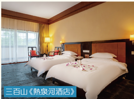
三百山《熱泉河酒店》