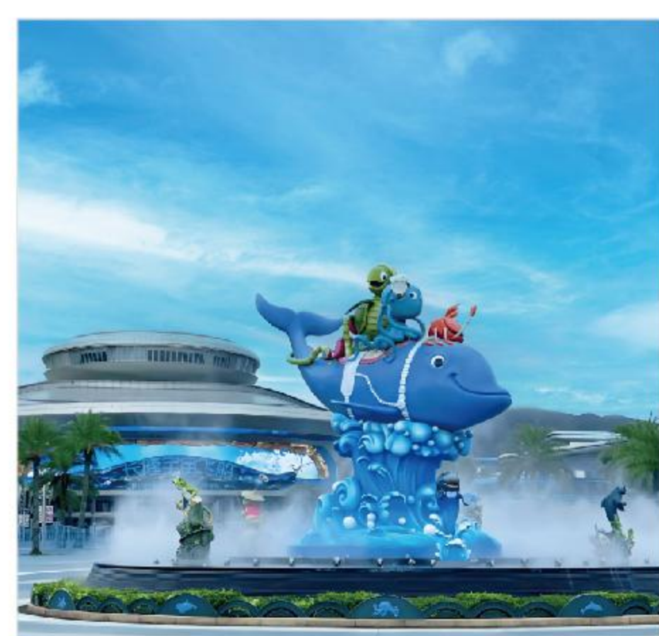
*以上圖片僅供參考