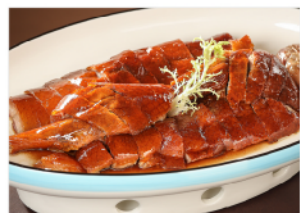
*以上圖片僅供參考

深圳集合時間及地點 09:30 [福田口岸]集合 (11號門外) 出團時認準“廣東旅遊”旗幟 10:30 深圳灣口岸集合 (逾時不候)