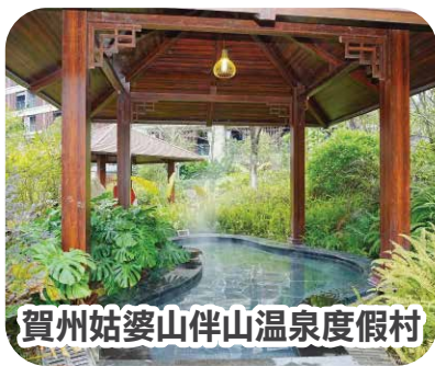
賀州姑婆山伴山溫泉度假村