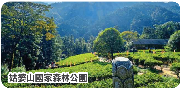
姑婆山國家森林公園